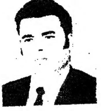
الشاعر - شفيق حبيب